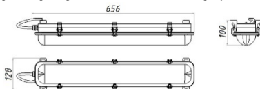
Рисунок 1 Светильник «L-sub 25»

1.5 Общий вид и габаритные размеры светильника показаны на рисунке 1.